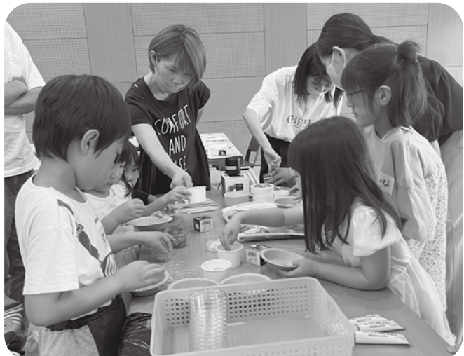
きらきらキャンドルカップづくり