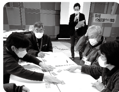
▲生活支援ボランティア養成講座の様子