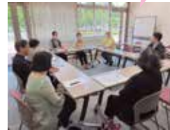
つながり会ピース H30年から活動 (甲賀)