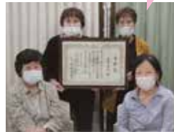
ほほえみ会 H24年から活動 (土山)