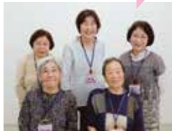
あいあい H29年から活動 (水口)