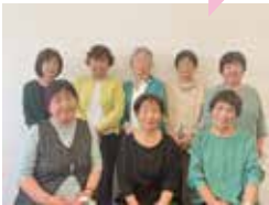
よりそい H22年から活動 (水口・甲南・信楽)