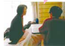
おしゃべり コーディネーター (甲南)