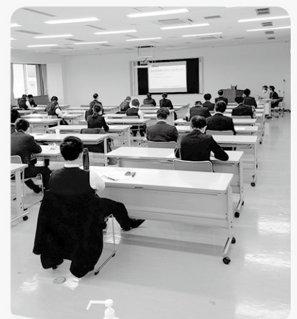
▲JAこうか様の職場研修で活用していただきました