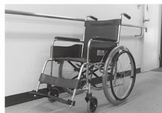
▲滋賀県宅地建物取引業協会 青年部様より