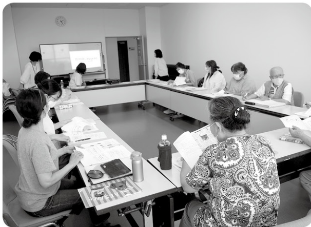
▲キャラバン・メイトが定期的に集まり、講座内容の確認や情報を共有しています