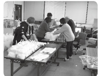
▲ボランティアの手で一世帯ごとに袋に分けて食材を準備しました