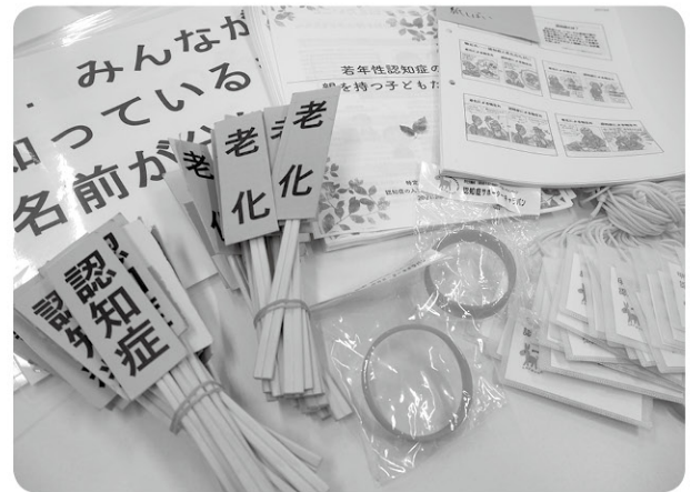
▲クイズなどの媒体を使い、わかりやすく説明しています