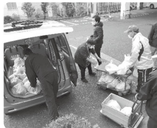
▲寄附いただいた方の思いを込めて対象の世帯に配布しました

令和2年12月には、フードバンクびわ湖、甲賀市ひとり親家庭福祉の会と連携し、「歳末応援物資配布事業」を実施しました。安心して年末を過ごしていただくために多くの方からの寄附物品を預かり、必要とされている甲賀市内の300世帯へ提供しました。