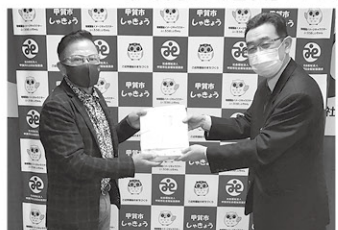
▲信楽カントリークラブ ニュー蘭友会様より