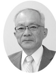
甲賀市社会福祉協議会会長