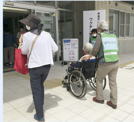
▲ボランティア活動のようす

そんな不安を抱えている方をサポートするために、甲賀市社会福祉協議会を通じて赤十字奉仕団や生活支援ボランティアグループ、登録ボランティア、民生委員児童委員のみなさまにボランティアとして会場内の案内や受付時のお手伝いなどでご協力いただいています！