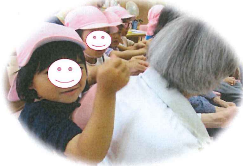
肩たたき・・・トントン・・・