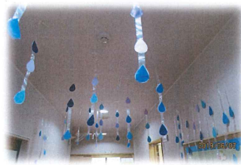
畑のために雨も欲しいのでふらせてみました!