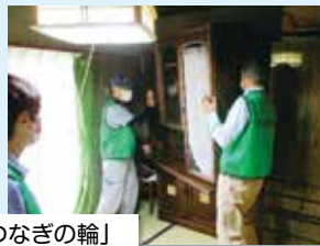
「つなぎの輪」 家具の移動