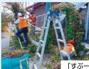
「すぷーん」 庭木の剪定