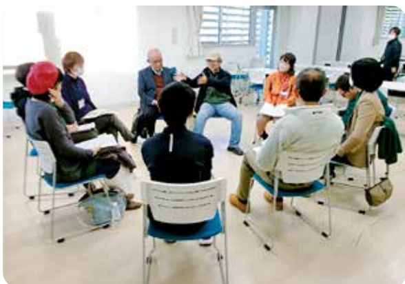
▲講演会後の交流の場面

11月25日(土) 地域共生フォーラム～プラットフォーム Koka2023～を市民活動センターまる一むで開催しました。フォーラム開催にあたっては、不登校や「ひきこもり」のご本人やそのご家族がこのフォーラムの主役であり、参加した人に気づきや出会いが生まれる、そんな温かい“プラットフォーム”づくりをめざしました。その甲斐あって、講演会をはじめ、絵画や写真、当事者・市民グループの活動展示やカフェ、同時開催のマルシェなどに沢山の方の来場がありました。この日生まれた沢山の小さな出会いの種を育む土壌づくりを、これからも地域のみなさんと共に丁寧にしていきたいと思ひます。