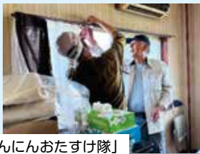
「にんにんおたすけ隊」 カーテンレールの取付

まずは一度、お問い合わせください 甲賀市社会福祉協議会 地域福祉課 TEL：76-3287 FAX：63-2021